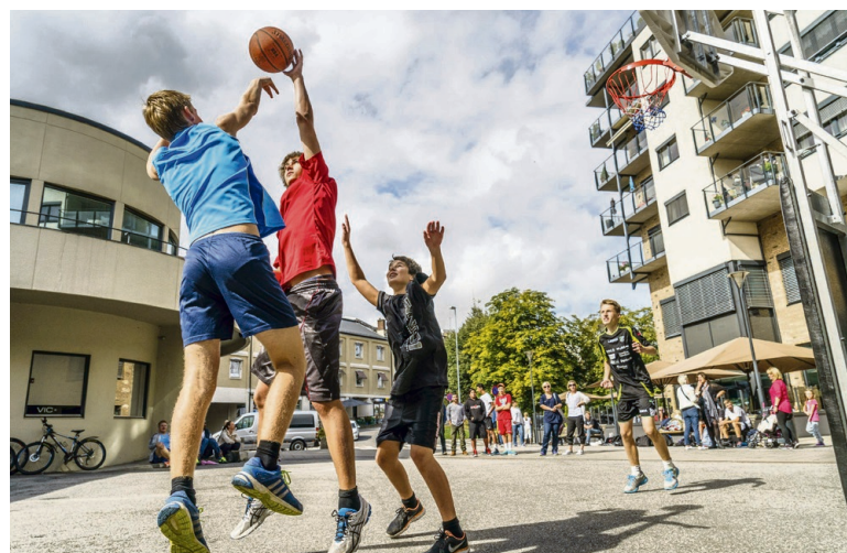
BASKET PÅ GATA: Basketball har alltid være en yndet aktivitet på gateplan.