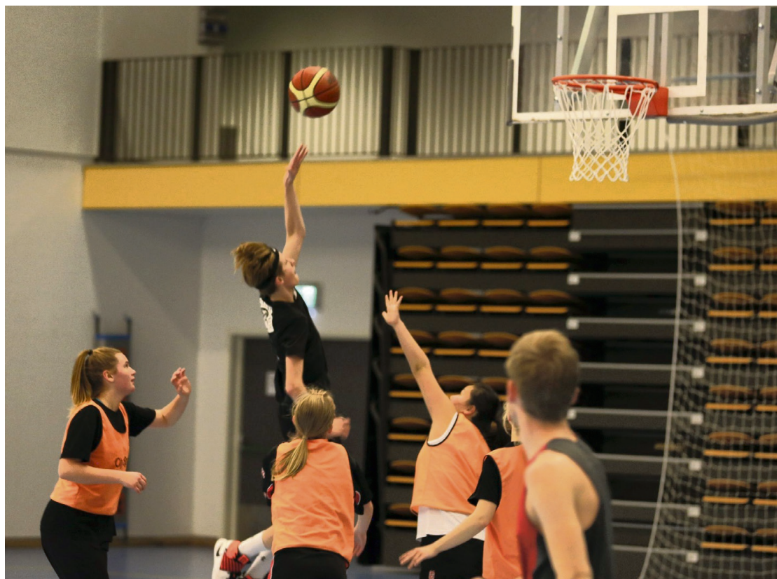
SPENSTIG: Spillerne i HBBK er del av et godt sportslig og sosialt miljø.